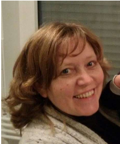
Born, Nelli „Nellis Nestchen“

Wilhelm-Rehling-Weg 10 32369 Rahden-Sielhorst